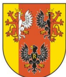
Marszałek Województwa Łódzkiego Witold Stępień